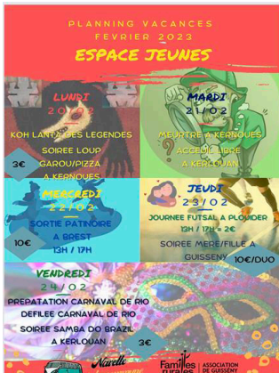
Programme 2ème semaine des vacances

Dans le cadre du nouveau partenariat mis en place entre les communes de Guissény, Kerlouan, Kernouës, Saint-Frégant et l'association Familles Rurales Guissény autour d'un projet jeunesse commun "PS Jeunes" des nouvelles actions sont mises en place sur le territoire.